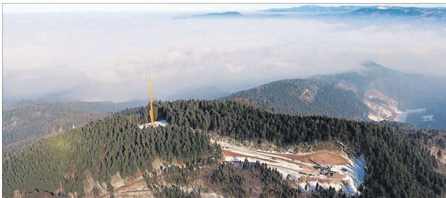
Am Sonntag konnte dieser Baustellenbereich auf dem »Steinfirst« des interkommunalen Windparks begutachtet werden. Der Kran steht auf Gemarkung Hohberg, der rechte und knapp 400 Meter entfernte Abschnitt mit Fundament für den zweiten Betonturm auf Bernersbacher Boden. Weitere zwei Windenergieanlagen entstehen südlich jeweils zur Hälfte auf Gengenbacher und Friesenheimer Boden auf dem »Rauhkasten«, wo in dieser Woche das letzte Fundament gebaut wird.